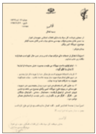
وثيقة معاون قائد الحرس الثوري في الاحواز شمال إيران

تشير التطورات الميدانية على مستوى الملف النووي الإيراني الى عكس ما يعنيه القادة الرسميون في تصريحاتهم العلنية من ان المنشآت النووية الإيرانية هي لأغراض سلمية وتظهر التطورات التي تطأ بجانب كبير من السرية ان طهران تخفي بانها من ملفها النووي قد يكون الوجه غير السلمي في هذا الملف. وفيما نتجه انظار نحو ما هو معلن من منشآت نووية إيرانية، لاسيما مقالع "دور خوين" ومفاعل "بوشهر" كشفت معلومات موثوقة "السياسة" ان السلطات الإيرانية تعمل سراً منذ سنوات، لاسيما منذ اثر الموضوع النووي قلماً إقليمياً ودولياً، لقضاء منشايتها عن الرقابة الدولية، وعن اي مساعلة لها فيما يتعلق بالنشاط النووي. وفي هذا السياق اكدت اوساط متابعه للملف النووي الإيراني لـ"السياسة" ان طهران بدأت تجهيز موقع سري لبناء مقالع نووي سري وصناعة القنبلة الذرية في منطقة الزرقان الواقعة على اطراف مدينة..... (التتمة من 37)